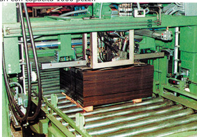
Mod. LIGO-T 80 Mod. LIGO-T 90 Applicazione con reggia in acciaio

Reggiatrice automatica per reggiature verticali PP-PET. Caricatore di angolari con capacità 1000 pezzi.